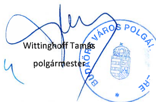
Wittinghoff Tamás polgármester